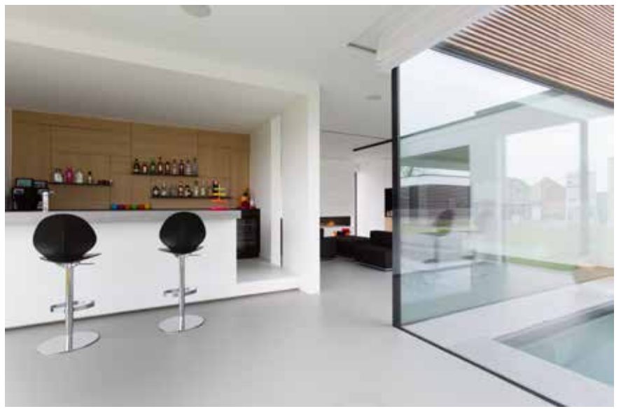
Let vooral op het strakke profielloze hoekraam en de naadloze overgang tussen de vloerplas binnen en het terrasniveau.

“Enkel een glazen wand vormt de scheiding tussen binnen en buiten”