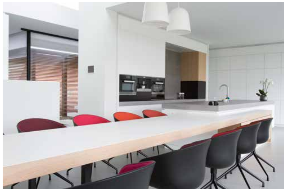
Accenten in eikfmeer enerzijds en kleurtoetsen in het losse meubilair anderzijds zorgen voor een leuke ambiance.

Ze zijn allemaal georiënteerd op één centraal kernelement in de woning: een supermeubel dat een speelhoek voor kinderen vormt. Het is verankerd met de kastenwand van de zitruimte, de trap naar de bovengelige verdieping en de vide. Op die manier ontstaat een centraal knooppunt met zicht op de keuken, de zitruimte en de verdieping. “Die transparantie met de bijzondere lichtinval vormt een belangrijke factor in het ontwerp”, vertelt architect Frederik Standaert van Block Office Architecten. De bovenverdieping bestaat uit twee zones: het gedeelte van de kinderen met drie slaapkamers en een aparte badkamer