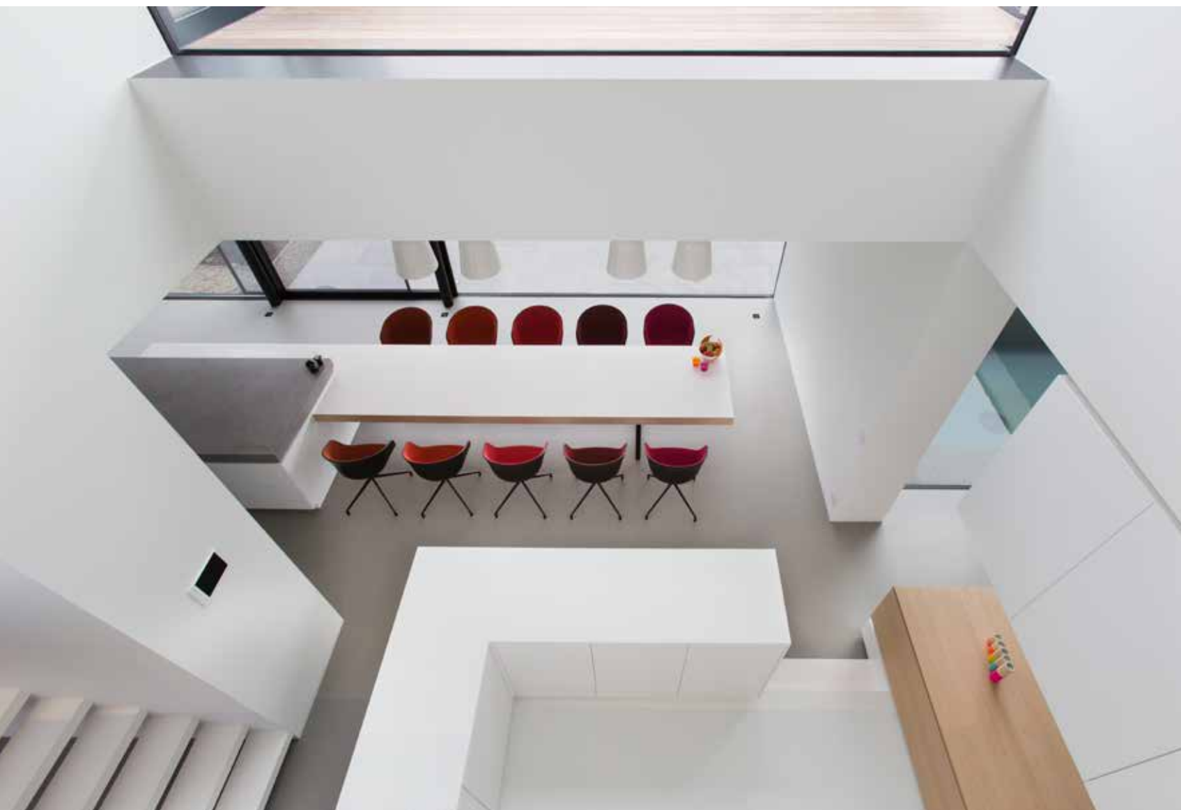
Zicht vanuit de nachthal in de vide. Het centrale meubel vormt de centrale spil in de ruimte. De vide zorgt voor een verrassingseffect.