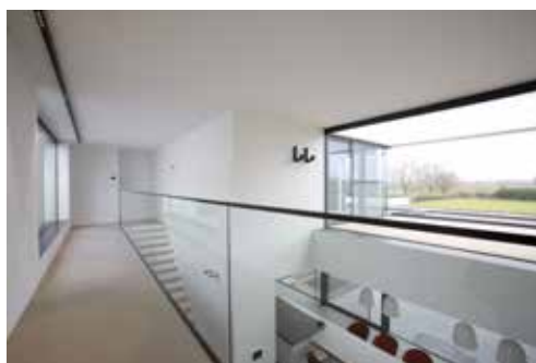
De woning vertoont een grote mate van transparantie, door het veelvuldig toepassen van glas.