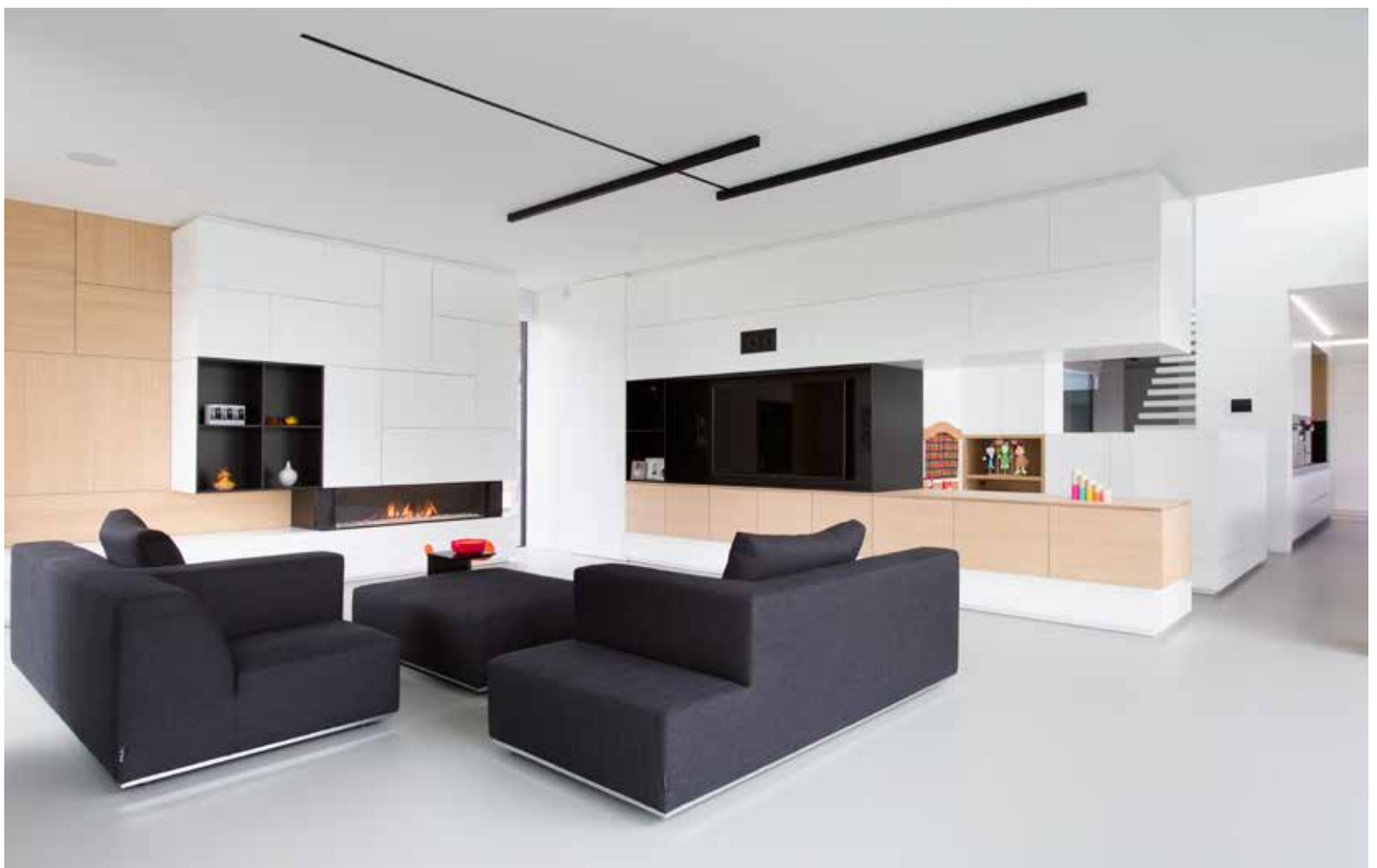
Maatmeubilair ordent de ruimte en zorgt voor rustgevende sfeer.