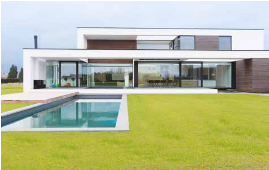
Zicht op de gestrekte achtergevel, waarin witte crepi, een houten latwerk en witte corian werden toegepast.

“Er ontstaat een opeenvolging van waterpartijen op verschillende niveau’s”