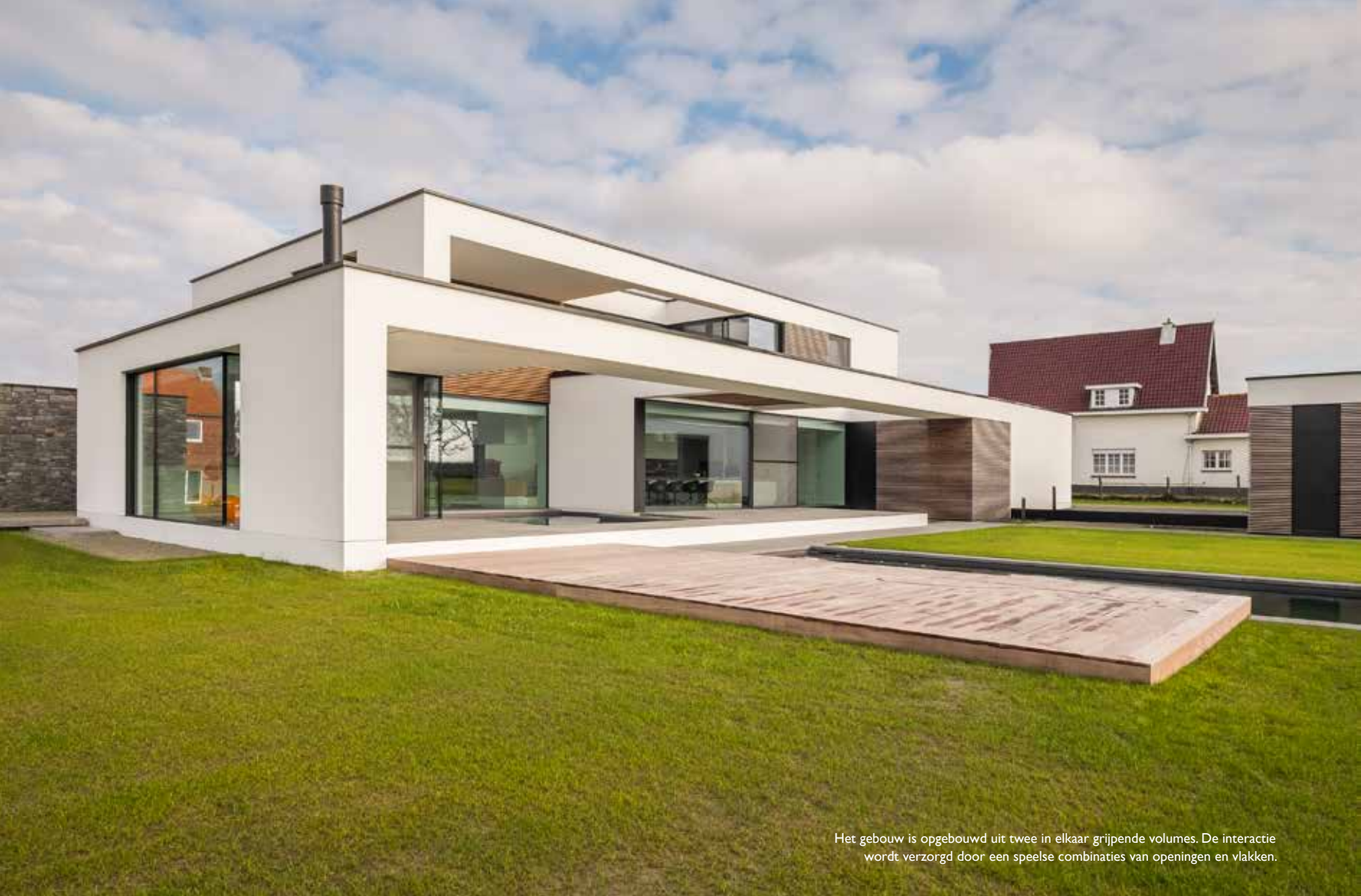
Het gebouw is opgebouwd uit twee in elkaar grijpende volumes. De interactie wordt verzorgd door een speelse combinaties van openingen en vlakken.