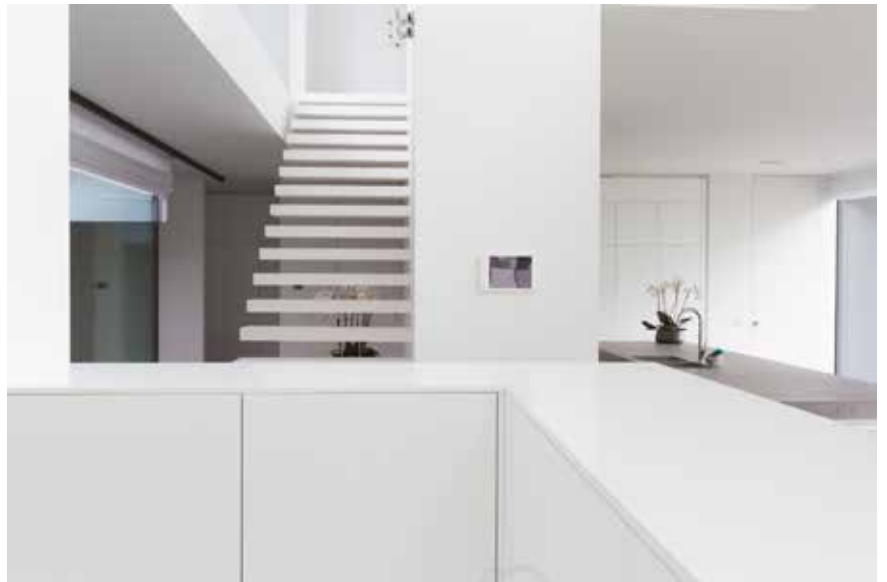
Een oase van wit dat het licht weerkaast doorheen de open ruimte.