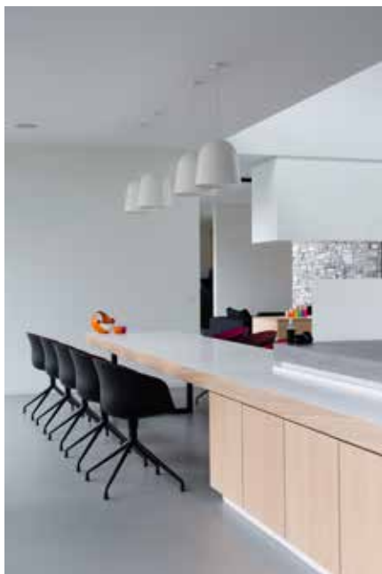
Het kookeiland vormt samen met de eettafel één geheel en wordt d.m.v. Een uniform materiaalgebruik verbonden.