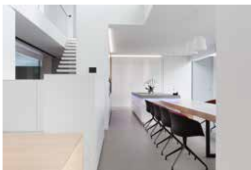
Zicht vanuit de nachthal in de vide. Het centrale meubel vormt de centrale spil in de ruimte. De vide zorgt voor een verrassingseffect.