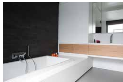
In de badkamer werden natuursteenstrips, gelakte mdf en eikfineer toegepast.